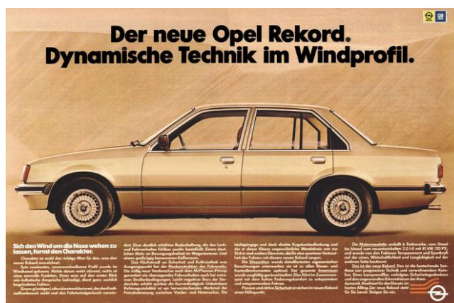
Opel Rekord E