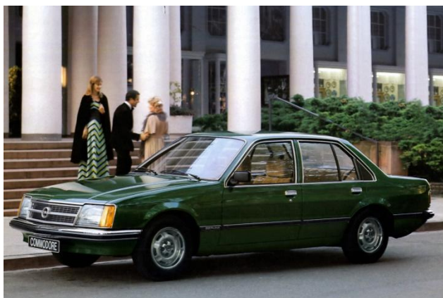
Opel Commodore C