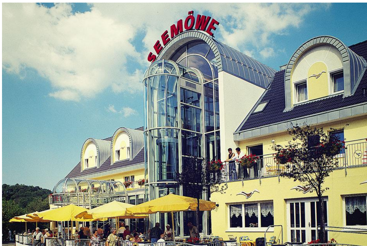
Hotel Seemöwe, Simmerath-Einruhr

Freitag, 05.06.2026 bis Sonntag, 07.06.2026