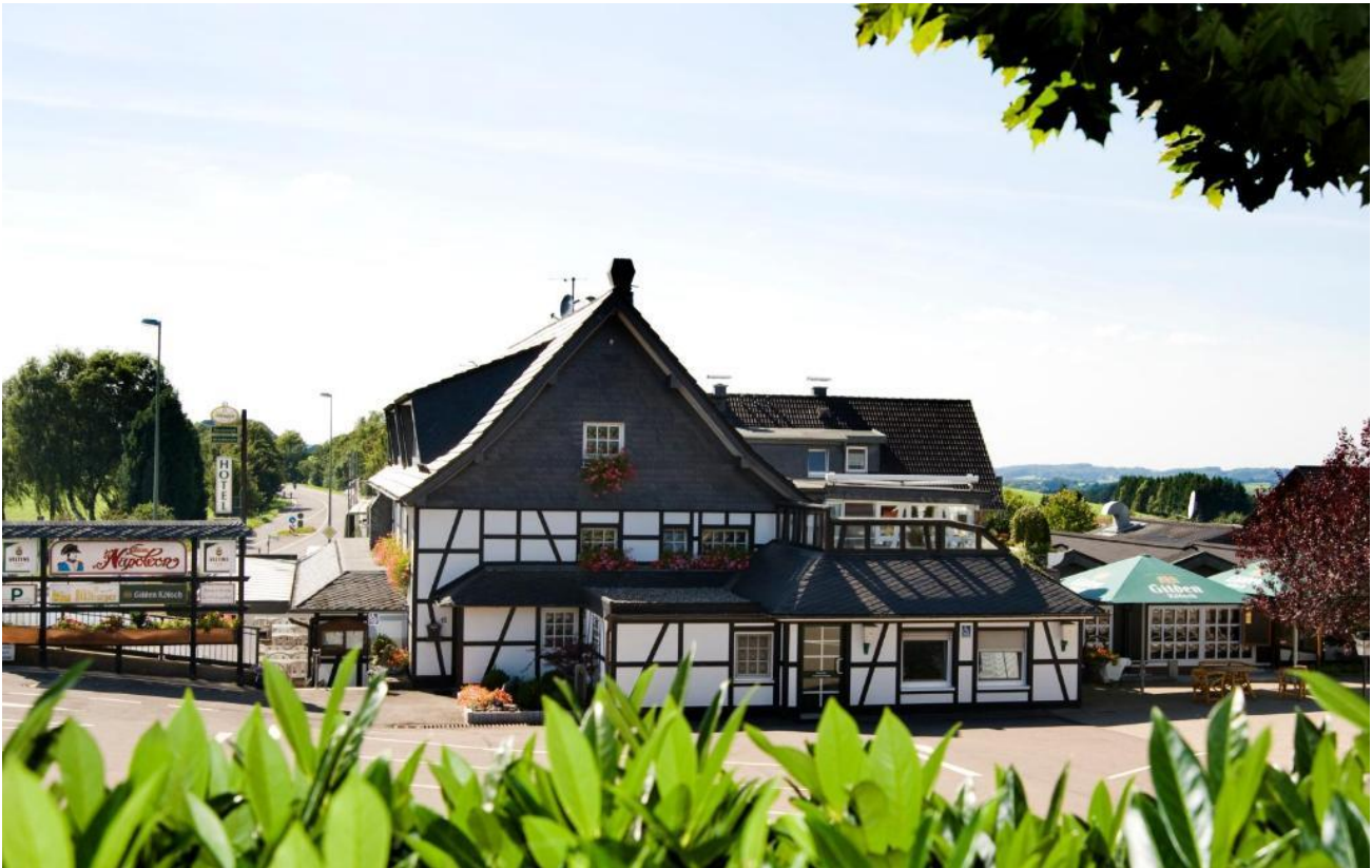
Landhotel Napoleon, Wipperfürth