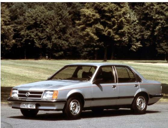
Opel Commodore C