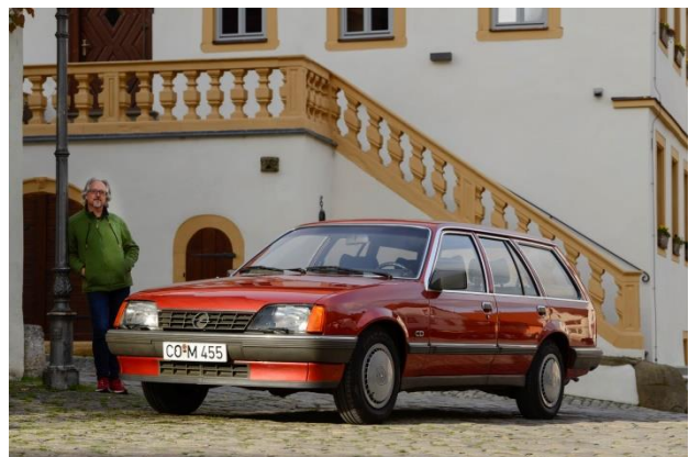
Opel Rekord E2