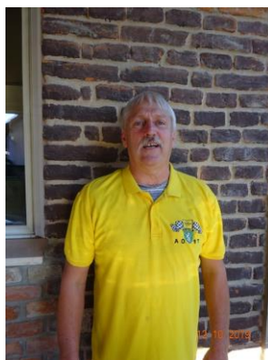
Wolfgang Wiedner (Organisation)