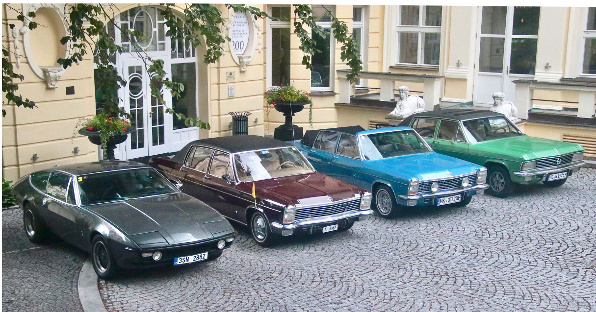
Jubiläumsfahrt nach Marienbad 2019: Opel-Großwagen vor böhmischen Hotel-Ensemble