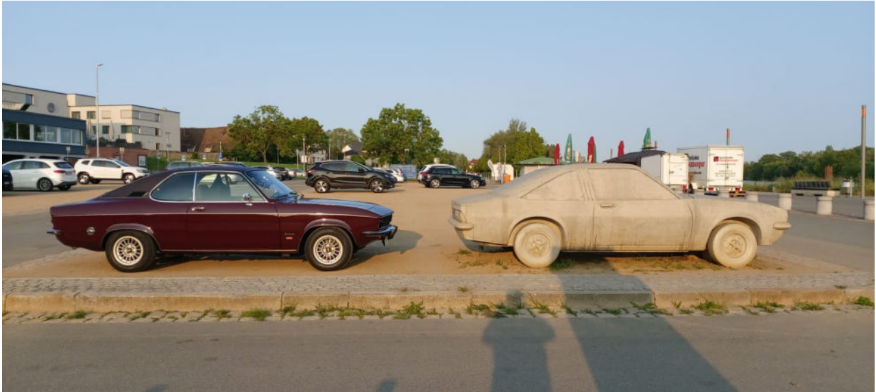
Immer eine Reise und ein Foto wert: Der Beton-Manta B auf dem Landungsplatz, direkt am Main in Rüsselsheim