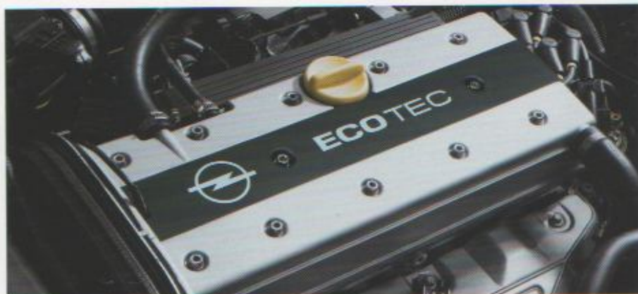
Der 16V-ECOTEC-Motor mit 100 kW (136 PS) zeichnet sich aus durch exzellente Fahrleistungen und äußerst sparsamen Verbrauch.