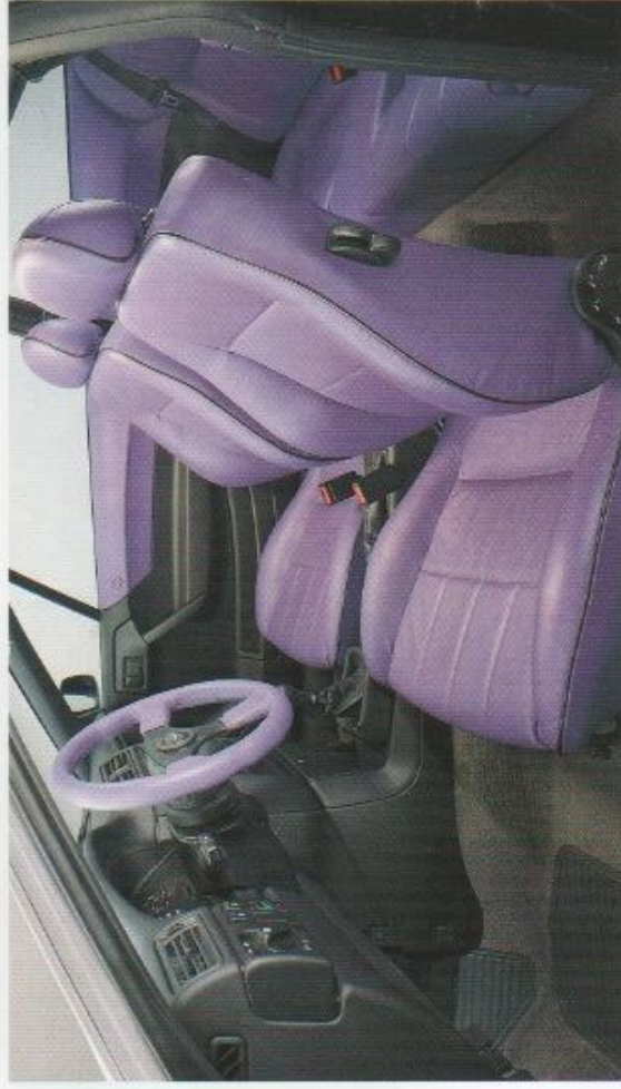
Leder-Innenausstattung in Sonderfarbe XI-01.