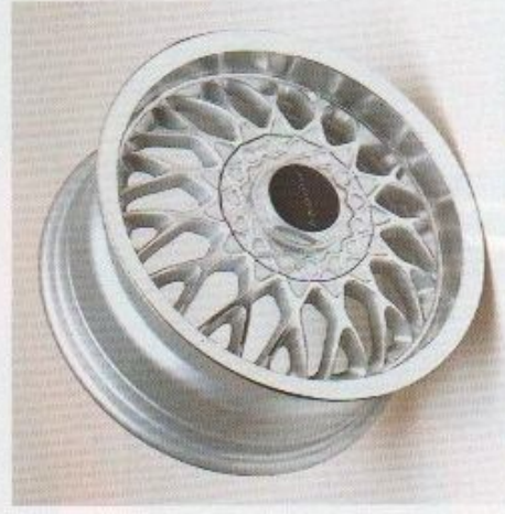
LM-Felge im Irmischer Kreuzspeichen-Design.