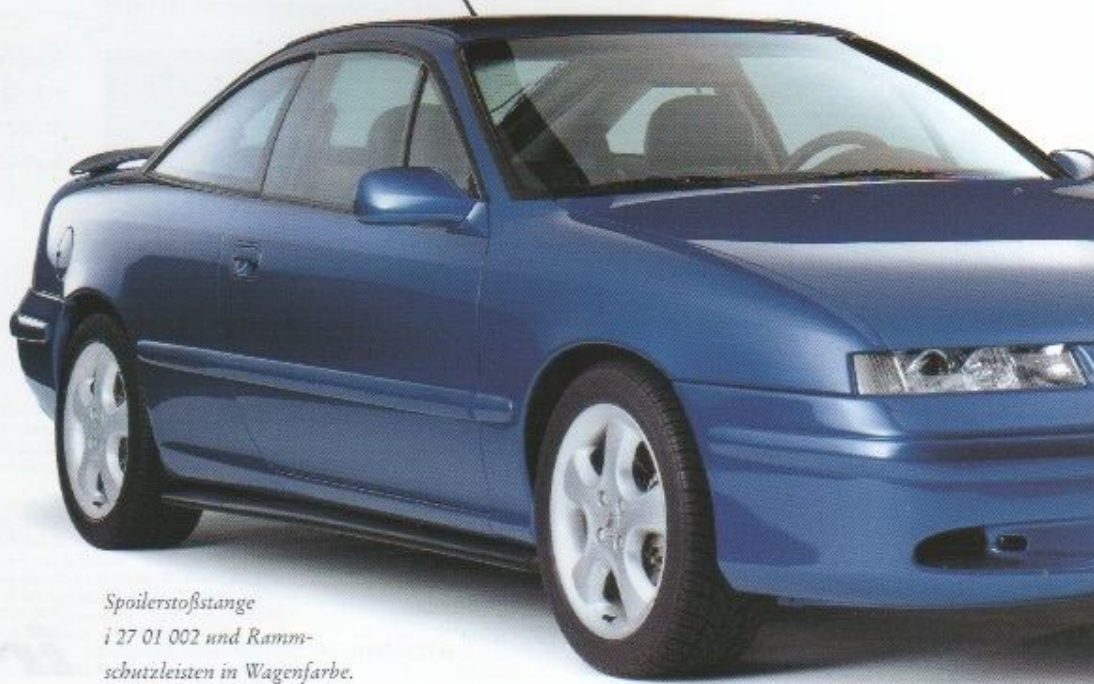
Spoilerstoßstange i 27 01 002 und Ramm- schutzleisten in Wagenfarbe.