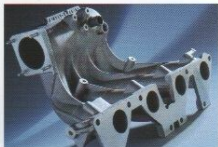
Leistungssteigerung durch ein modifiziertes Saugrohr.

Leistungssteigerungen für den 2.0 l Saugmotor und für den Calibra Turbo von bis zu 30 Mehr-PS sorgen für größere Kraftreserven. Optimiert wird die Leistung durch einen irmscher LINE Nachschalldämpfer mit rechteckigem Doppel-Endrohr, der auch den optischen Akzent am Heck des Calibra setzt.