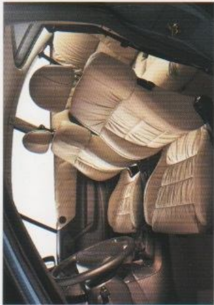
Ein Platz, auf dem man wieder einmal die ganze Freude am Fahren erleben kann. (Abb.: «Diamond» - Lederinterieur beige).