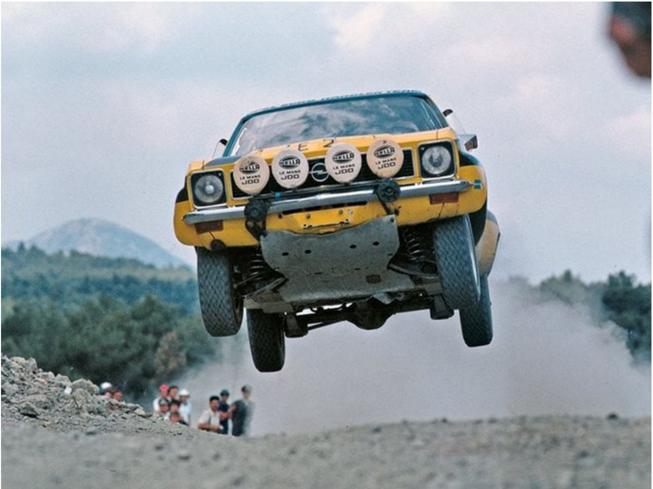
Fliegen ist doch schöner. Ascona-A des „Opel Euro Händler Teams“ auf der Akropolis-Rallye 1974 in Griechenland.