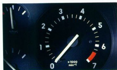
Corsa GSi. Sportinstrumente mit Voltmeter, Drehzahlmesser und Öldruckmesser.

Wir haben unsere Entscheidung für den Corsa GSi noch nicht eine Sekunde bereut. Ganz gleich, ob wir zum Sport fahren oder zum Spaß unterwegs sind, er ist ein stets gut gelaunter und zuverlässiger Partner.