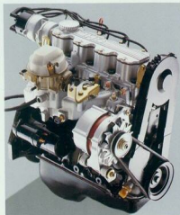
1.4i-Motor mit regeltem Katalysator.

Alle Corsa-Motoren zahlen sich durch Steuerbegünstigungen schnell aus und sind – typisch für Opel – sprichwörtlich zuverlässig.