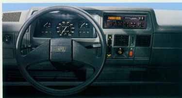
Corsa Swing. 2-Speichen-Komfortlenkrad, Tageskilometerzähler.

Corsa Swing einzusteigen. Übersichtliches Cockpit, griffiges Lenkrad, die Sitze chic