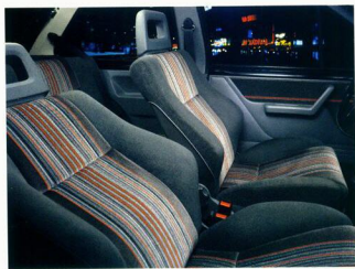
Corsa GSi. Sportsitze mit speziellem Design aus hochwertigem Velours.

Der Corsa GSi und wir zwei sind ein Superteam. Das haben wir beim ersten Einsteigen gemerkt. Die Sportsitze geben prima Seitenhalt, und selbst auf langen Strecken wird man nicht müde. Mit dem Sportlenkrad haben wir den munteren Burschen gut im Griff, und die Sportinstrumente geben die wichtigsten Informationen auf einen Blick.