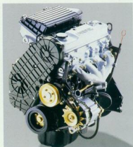
1.5 D-Motor, 37 kW (50 PS).

Auch für unseren Kleinsten ist uns kein Aufwand zu groß. Hinter dem Corsa stehen, genau wie hinter jedem anderen Opel, hochqualifizierte Ingenieure mit modernsten Forschungsanlagen. Selbst für die Konstruktion kleinster Details scheuen sie weder aufwendige Forschung noch einen enormen technischen Einsatz über Wochen und Monate, denn die Fahrzeuge müssen härteste Tests bestehen. Servicefreundlichkeit und aufwendige Korrosionsschutzmaßnahmen sind von vornherein eingeplant und garantieren, daß Ihr Corsa auf lange Jahre Ihren Erwartungen entspricht.