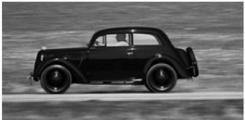
...für den Opel Kadett und Olympia der jeweils ersten Serien. Hier im Bild ein Kadett in voller Fahrt